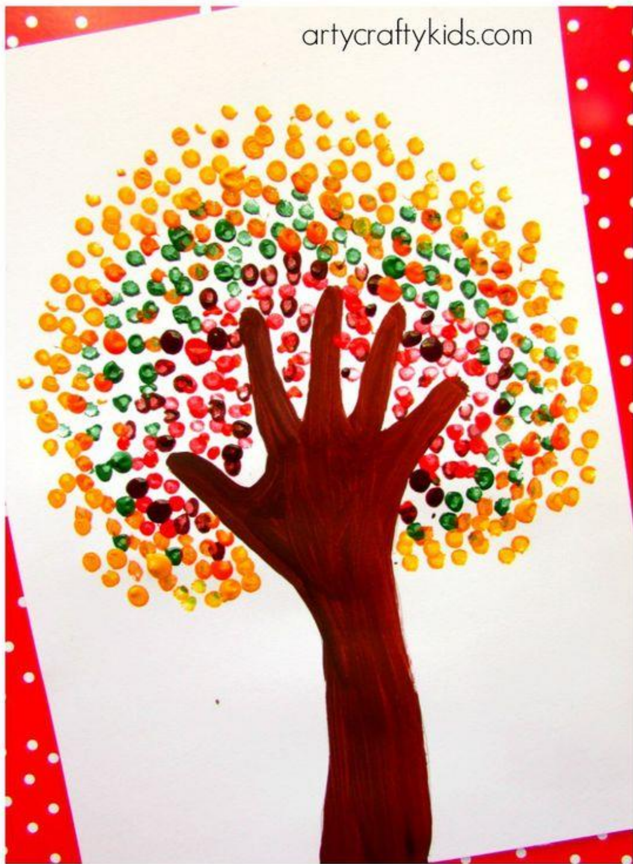
Autumn Handprint Tree